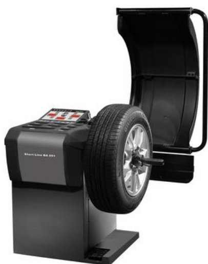
Start Line BA 201 | RAL5015