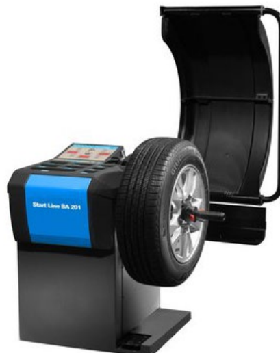
Start Line BA 201 | RAL5015

Start Line BA 201 – Балансировочный стенд начального уровня с легко читаемым индикаторным дисплеем, механической системой блокировки, для балансировки колёс легковых автомобилей, мотоциклов и коммерческой техники.